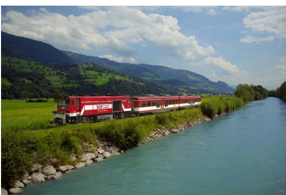
Mit der integrierten Pinzgauer Lokalbahn die Sehenswürdigkeiten erkunden

Im Sommer 2016 wurde der komplette öffentliche Linienverkehr, die Tälertaxis sowie der E-Bike-Verleih in der Nationalpark Region in die völlig neu organisierte "Nationalpark Sommercard mobil" integriert – eine Gästekarte, die an Urlauber/-innen ab einer Nächtigung durch die Partnerbetriebe gratis ausgestellt wird. Diese Aufwertung des öffentlichen Verkehrs soll zu einer Entlastung der Region durch die negativen Auswirkungen des Autoverkehrs insbesondere auch der sensiblen Seitentäler in der Nationalparkregion beitragen.