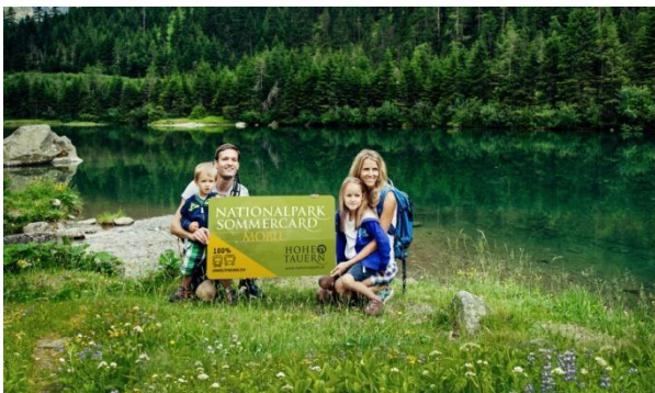
Die Nationalpark Sommercard mobil.